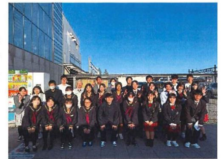
皆さんお疲れ様でした！

10月14日（土）14:30に、弘前駅中央口・城東口にて私学助成街頭署名を実施しました。天気に恵まれ、数年ぶりに街頭署名を実現できたことは、非常に喜ばしく思ひます。弘前市内の私立高校生27名が参加し、元気よく署名運動を行ってくれました。その結果、2カ所で合計 131筆 の署名を集めることができました。