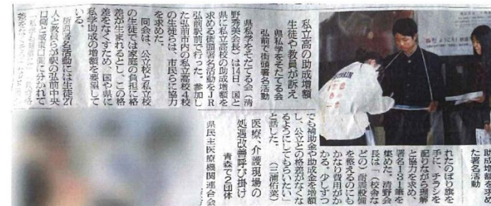
10月15日（日）の陸奥新報に記事が掲載されました