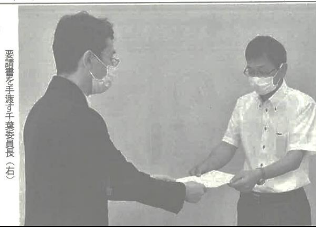
要請書を手渡す千葉委員長(右)